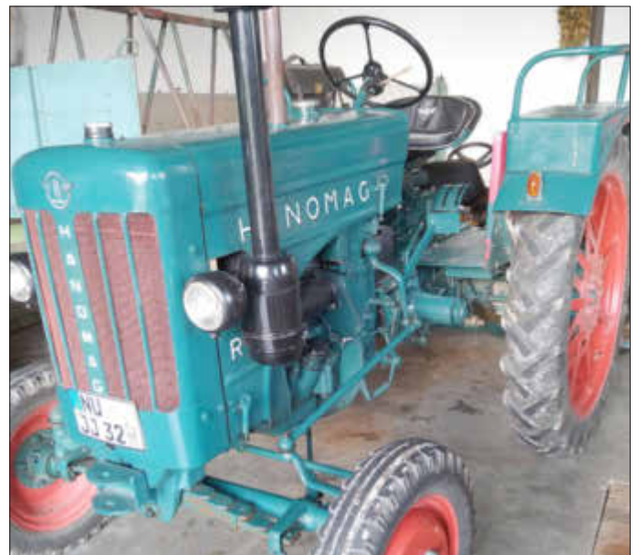
HANOMAG R16, BJ. 1954